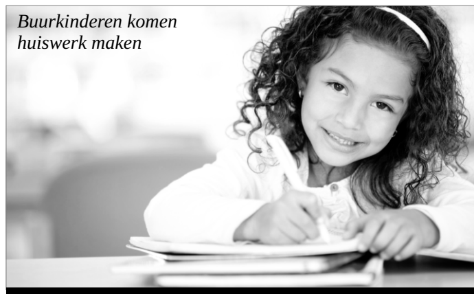
Buurkinderen komen huiswerk maken

Na een jaar gezamenlijk wonen kan ik met zekerheid zeggen dat deze vorm van wonen goed bij me past. Ik zou niet anders meer willen en vertel anderen ook vaak enthousiast over het leven in CW Ede. Ik hoop dat steeds meer mensen deze vorm van wonen ontdekken, zodat we elkaar kunnen helpen en van elkaar kunnen genieten.