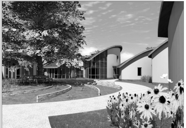
Impressies Ecodorp Boekel