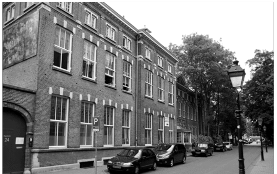
Woongroep De Paap in Den Bosch

Het gesprek over het veilig stellen van de WoongroepenDag begon met wat er nodig is om die dag te organiseren. Wat je kunt leren van je voorganger. Bij Iewan hadden zich 80 mensen opgegeven, De Paap wilden de grens bij 100