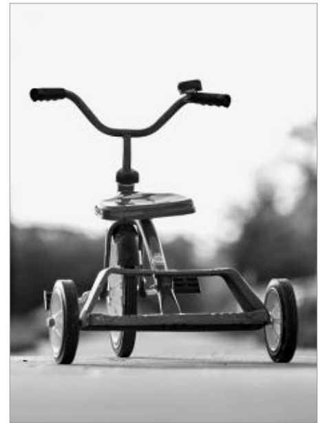
Andere kinderen kunnen ermee spelen