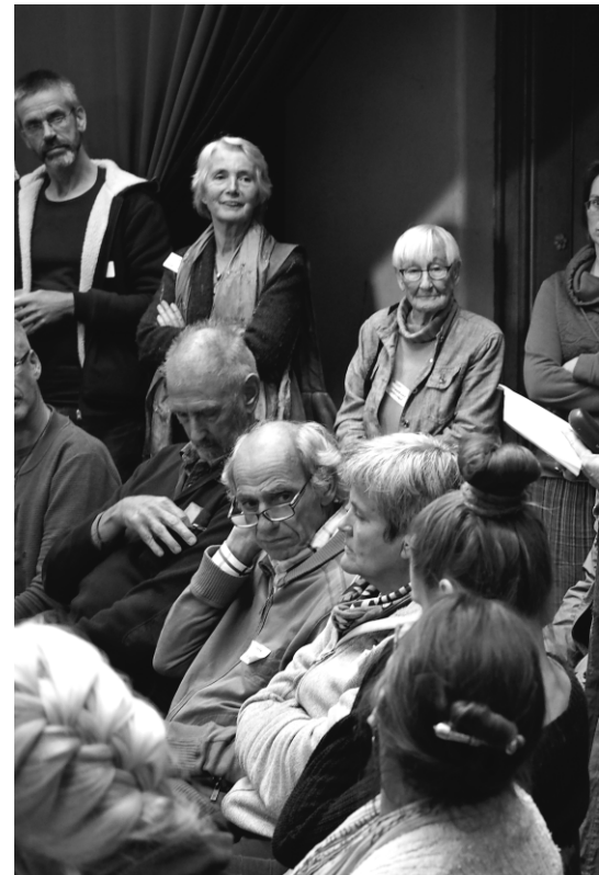
Uitwisseling van ervaringen vanuit de workshops

Gewerkt wordt in groepjes. Maak met een lint een cirkel om je heen die jouw invloed aangeeft binnen je woongroep. Maak daarom heen een cirkel van jouw betrokkenheid. De deelnemers in elk groepje maken om de beurt de twee cirkels. Staand in de cirkel van invloed vertelt ieder iets over zijn invloed, betrokkenheid en knelpunten die daarbij ervaart worden.