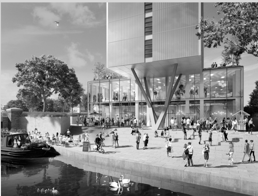
Old Oak Collective