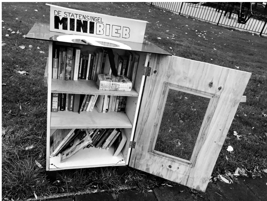
Buurtboekenkast in het groen van De Statensingel

Zij zijn niet de enige buurtgenoten die met Centraal Wonen verwante, gezamenlijke activiteiten ontwikkelen. Zo zie je in Blijdorp Rotterdam op verschillende plekken 'buurtboekenkasten' verschijnen. Ook hebben de bewoners van woningen die tegenover een stukje openbaar groen liggen een soort van 'gemeenschappelijke buitenkamer' ingericht, waar zij regelmatig samen van koffie of een ander drankje, al of niet met barbecue, genieten. Dat wordt op z'n minst gedoogd.