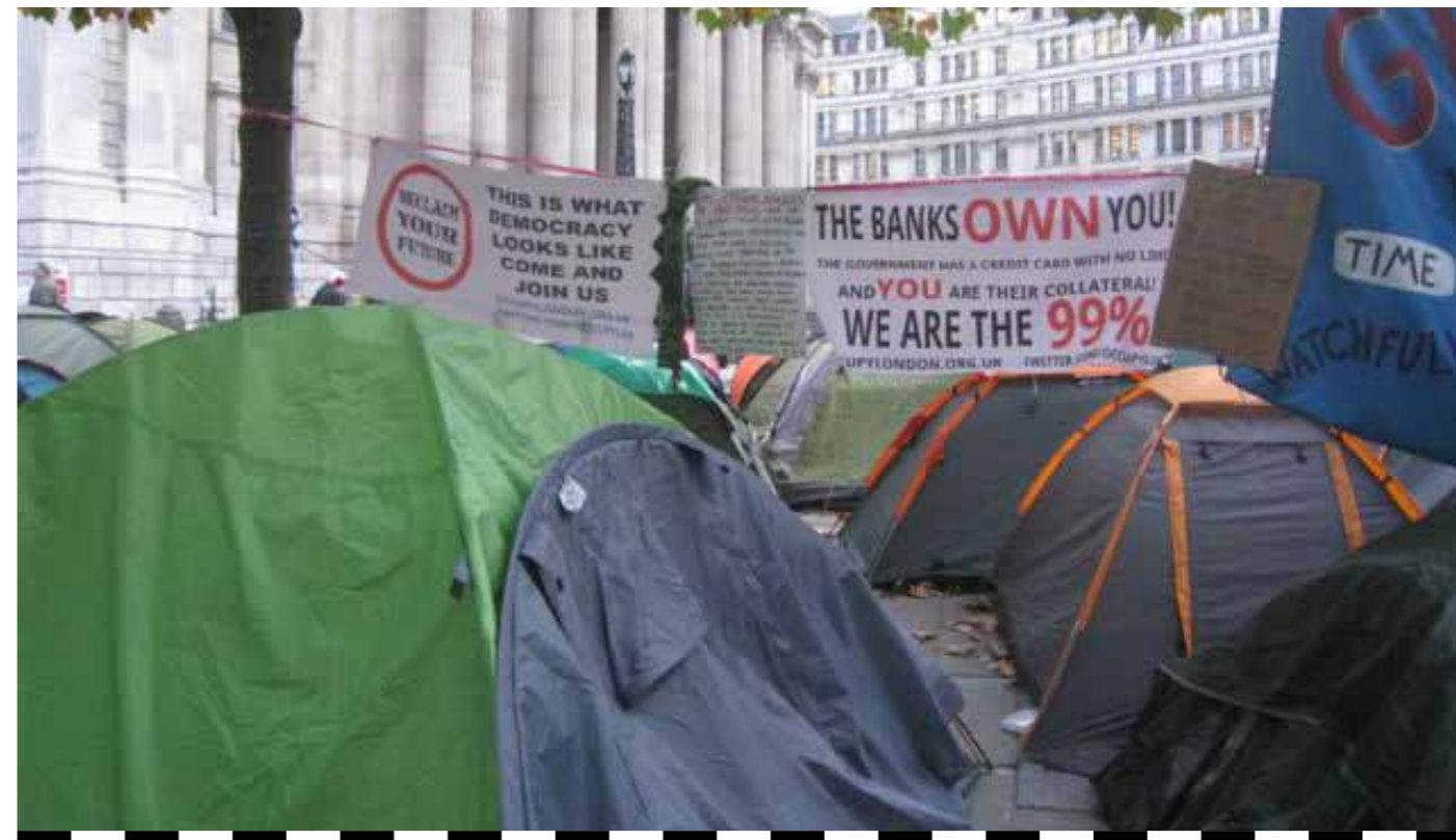
foto linker en rechter pagina: Occupy in Londen Harriet Ward november 2011